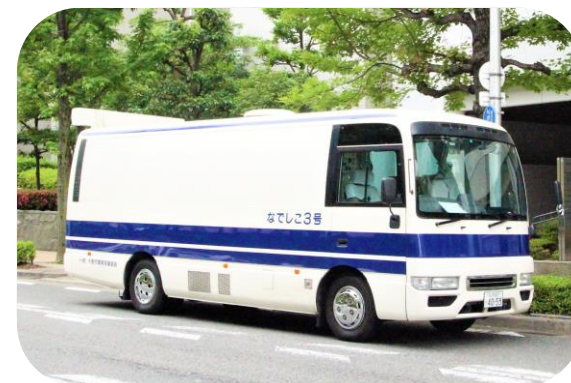
<検診車 なでしこ3号>